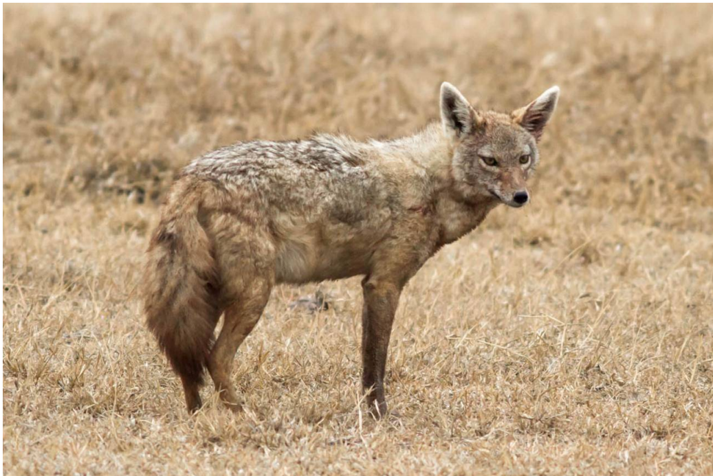
Chacal en el Área de Conservación de Ngorongoro (Tanzania). / Daniel Montero López y Borja Figueirido

Durante los últimos 40 millones de años, la vegetación y los hábitats de herbívoros y carnívoros se han visto alterados por el impacto del cambio climático. Con ellos el comportamiento predatorio de los cánidos (como lobos, zorros y perros pintados africanos) también se ha modificado. Hasta ahora, los científicos pensaban que únicamente los herbívoros se veían afectados por los cambios en la vegetación.