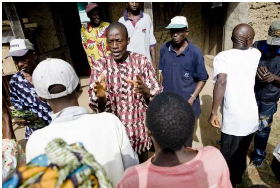
Habitantes de un pueblo de Sierra Leona.