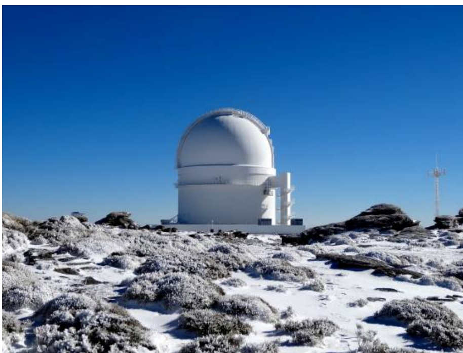
Cúpula del telescopio de 3,5 m en el Observatorio de Calar Alto donde está instalado el instrumento Carmenes.

Para hallar una explicación a este anómalo sistema, el consorcio Carmenes ha trabajado en estrecha colaboración con grupos de centros como Instituto Max Planck de Astronomía (Alemania), la Universidad de Berna (Suiza) y el Observatorio de Lund (Suecia), líderes mundiales en el estudio de formación de planetas. “Pero tras múltiples simulaciones y largas discusiones, concluimos que nuestros modelos más actualizados nunca podrían explicar la formación de un solo planeta gigante, y mucho menos de dos”, explica Alexander Mustill , investigador del Observatorio de Lund.