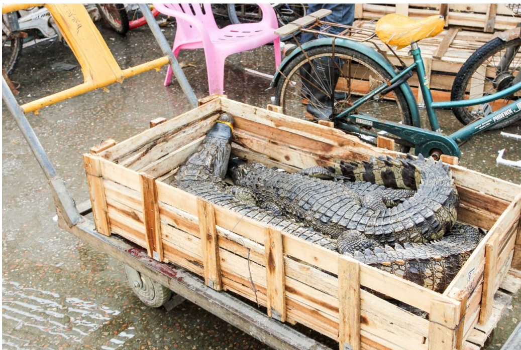
Típico comercio de peces y cocodrilos en Guangzhou, China.

“Los datos sociodemográficos indican que el consumo de carne de animales silvestres en las zonas urbanas no es para subsistencia, sino que está más bien impulsado por la preferencia y la tradición dietética”, señala el equipo internacional liderado por la Wildlife Conservation Society .