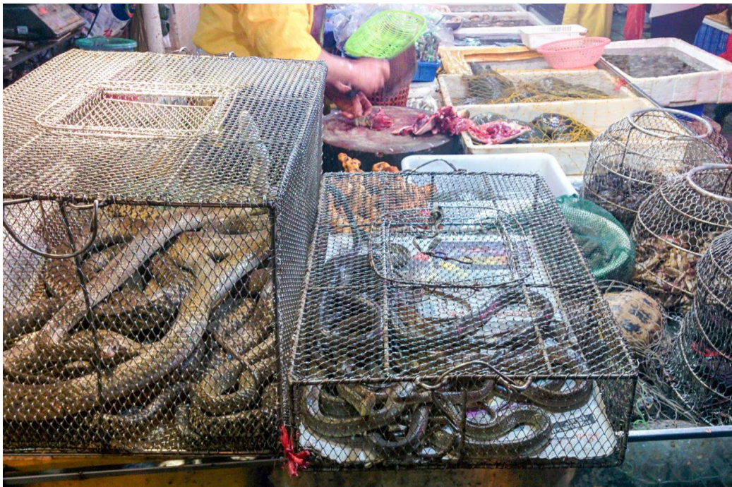
Animales comercializados en los típicos mercados húmedos asiáticos.

A las pocas semanas de iniciarse la epidemia de SARS-CoV-2 en China , el país prohibió en febrero el comercio de animales salvajes para consumo humano en sus populares mercados. El veto impedía la venta de ejemplares procedentes de granjas de especies exóticas y del tráfico ilegal , uno de los negocios ilícitos más lucrativos de esta región del mundo.