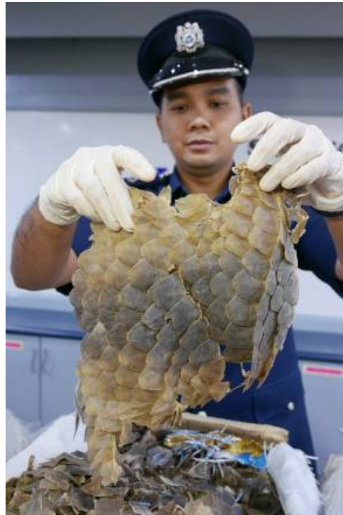
Escamas de pangolín incautadas.

“Estos animales se mezclan con múltiples especies diferentes en condiciones insalubres, creando un ambiente perfecto para que los patógenos que transportan salten de una especie a otra”, revela a SINC.