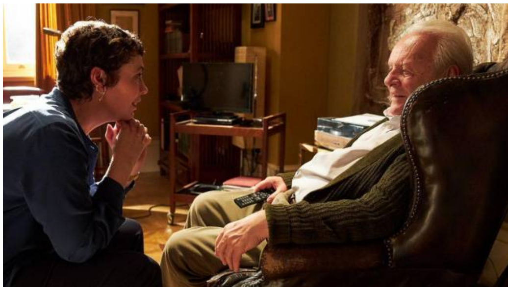
Fotograma de la película El Padre