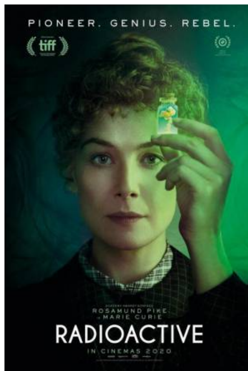
Cartel original de la película Radioactive (Madame Curie en castellano)