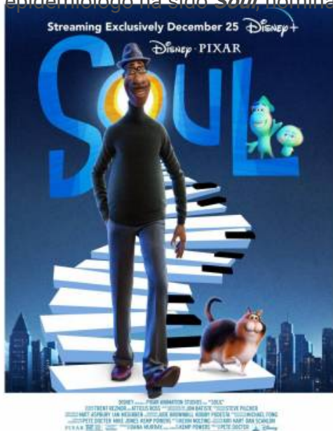
Cartel de la película de animación Soul

el epidemiólogo ha sido Soul nominada tanto a Mejor Película Animada