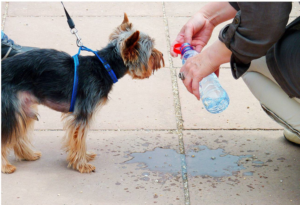
Un perro bebe agua de una botella para refrescarse en verano.

Los perros también pueden sufrir insolaciones y sus mucosas se pueden volver azuladas (cianosis). “En casos más graves podemos encontrar signos digestivos, como vómitos y diarrea o incluso pueden entrar en shock”, señala Esperón. Una insolación muy fuerte puede llegar a coagular parcialmente las proteínas de la sangre, causando problemas de coagulación y trombos.