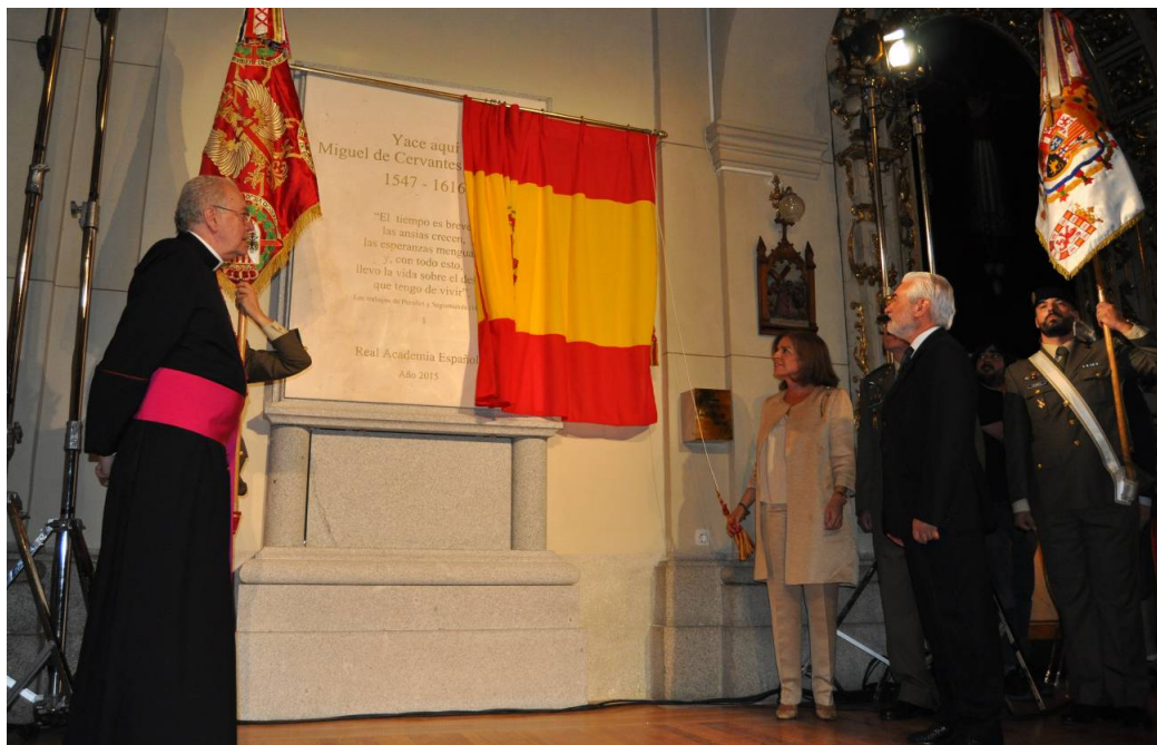
Inauguración del monumento que alberga los restos de Cervantes.

"Yace aquí, Miguel de Cervantes Saavedra (1547-1616)" . Así comienza la inscripción de la placa del monumento a Miguel de Cervantes que la alcaldesa en funciones de Madrid, Ana Botella, ha descubierto esta mañana en el convento de Las Trinitarias.