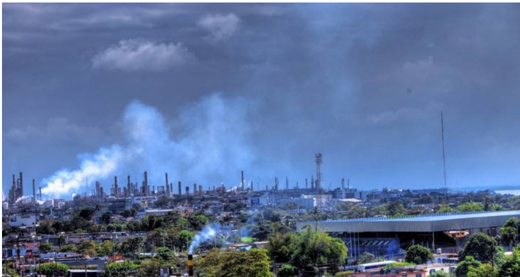
Emisiones de gas en México.

Una encuesta efectuada por el Pew Research Center ( think tank con sede en Washington, EE UU) con entrevistas 45.340 personas de 40 países diferentes revela que el cambio climático es la principal preocupación a escala mundial .